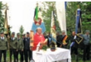
(17.05.) Bergmesse auf dem Falkenstein