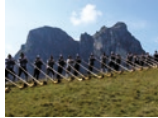
(27.09.) Alphornbläser des Allgäu-Schwäbischen Musikbundes auf dem Breitenberg