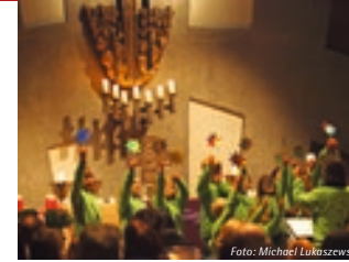
(13.12.) Atempause im Advent der evangelischen Kirchengemeinde