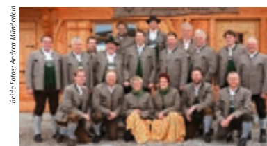
Beitrag Foto: Andrea Mändlestein

Die Pfrontener Alphornbläser blicken als die im Allgäu älteste Alphorngruppe auf eine lange Geschichte zurück, die bis in die Mitte des letzten Jahrhunderts zurückreicht. In der aktuellen Besetzung treten die fünf Herren und eine Dame rund 20 mal im Jahr zu verschiedenen Anlässen auf. Doch auch der Nachwuchs steht schon in den Startlöchern, so dass sich Einheimische und Gäste weiterhin vom faszinierenden, melodischen Klang der Alphörner begeistern lassen können.