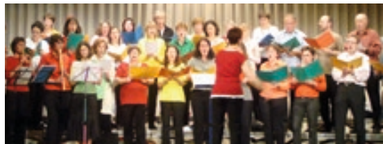
(30.05.) Benefizkonzert des »Cantissimo«-Chor aus Reutte